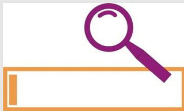
专利信息分析、评估